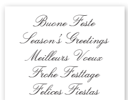
Formula augurale 1 Carattere: corsivo inglese corpo 20