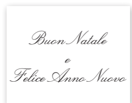
Formula augurale 2 Carattere: corsivo inglese corpo 24